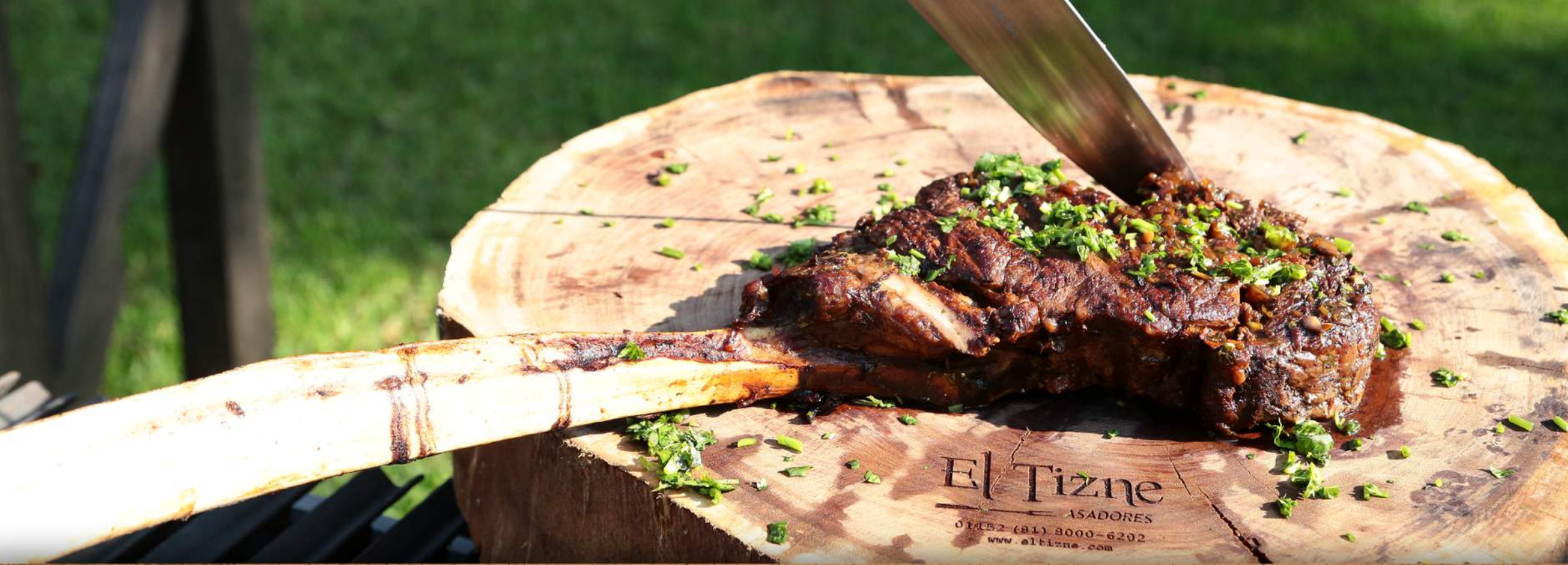
HOLZBRETT | TT-CMM01